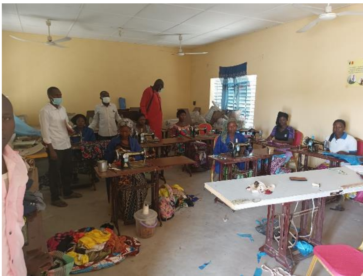
Photo avec les jeunes filles de la ville de Massakory bénéficiaires de la formation en couture initiée par le projet SWEDD

Photo illustrant la séance de formation en couture initiée par le projet SWEDD des jeunes filles de la ville de Massakory